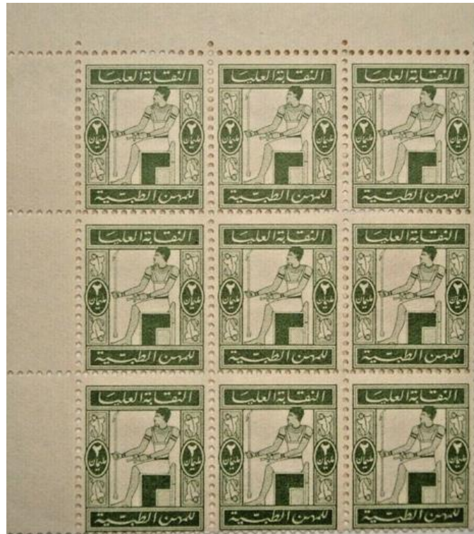
Bloc de 9 timbres fiscaux du Syndicat médical Egyptien. (1942)