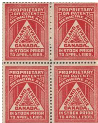
Bloc de 4 timbres taxe Médecine interne VanDam (1909) Pas de valeur faciale - Perf : 12 Edition en feuillet de 100

Le fisc canadien émet un timbre spécial pour identifier ces produits avant la date effective d'entrée en vigueur de la nouvelle loi.