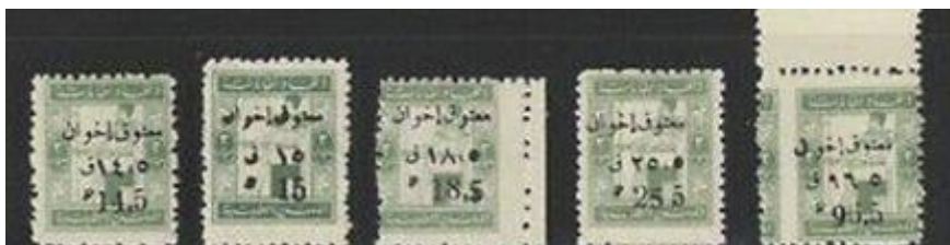
Timbres avec surcharge.

Le Syndicat médical égyptien est une association médicale comptant plus de 230 000 membres enregistrés. Environ 65 % des membres travaillent en dehors de l'Égypte. Elle a été fondée en 1940 et est une organisation semi-gouvernementale.