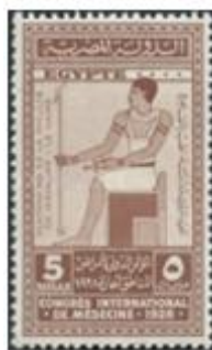
Congrès international de médecine au Caire & 100e anniversaire du Département de Médecine à l'Université du Caire.

Ce timbre fiscal est tiré du timbre édité auparavant en 1928